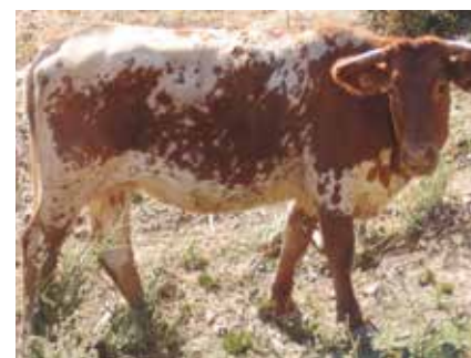
Animal NO apto por tonalidad anaranjada y distribución que denota cruce con otra raza

Serán desechables las tonalidades anaranjadas que denoten cruce de razas, así como aquella distribución de manchas que recuerden a capas características de, especialmente, la raza Mertolenga. También las atigradas.