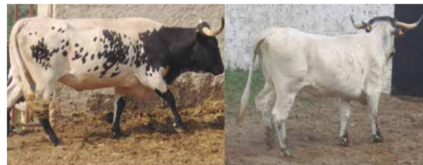
Botinero apto aunque no deseable por estar abierto por detrás

Tan sólo se aceptarán en hembras una unión del pigmento del tronco con el botinero, por pequeñas que sean, no siendo en absoluto aceptable en los machos.