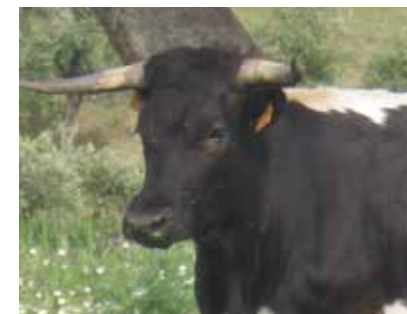
Perfil apto pero no recomendable por ser excesivamente concavo

Cuernos bien desarrollados, nacen de la línea de prolongación de la testuz, dirigidos hacia adelante en forma de gancho en los toros y abiertos en gancho alto con ligera torsión hacia atrás de la porción terminal en las vacas. Son de color blanco en la base y pizarrosos o negros en la punta. Orejas pequeñas.