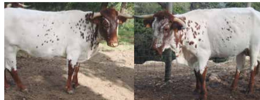
Animales aptos con capa capirote que sufren invasión de pelos blancos (salinero)

En el caso de los machos no se admitirán en la cabeza mechones blancos.