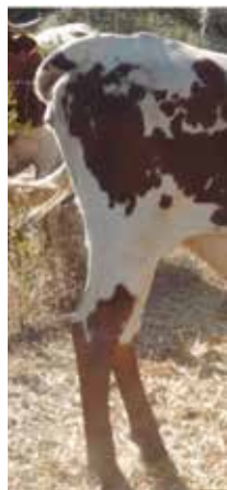
Nalga apta, pero no deseable por excesiva concavidad