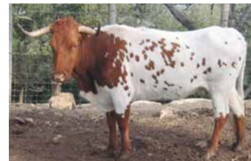
Línea dorsolumbar apta pero no deseable

Se puntuarán, tanto en machos como hembras, más la línea dorsolumbar recta que la que muestre una ligera depresión, siendo deseable las depresiones extremadamente manifiestas y el conocido como lomo de gato.