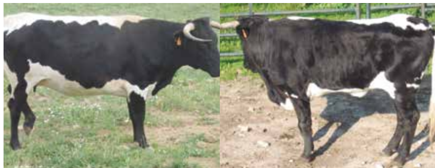
Botinero apto en hembras, NO en machos por estar unida una extremidad