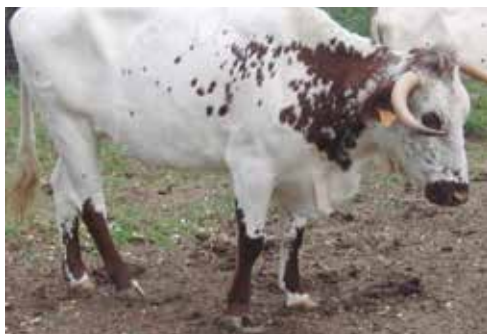
Botinero NO apto al tener pezuñas blancas

Tan sólo se aceptarán en hembras una unión del pigmento del tronco con el botinero, por pequeñas que sean, no siendo en absoluto aceptable en los machos.