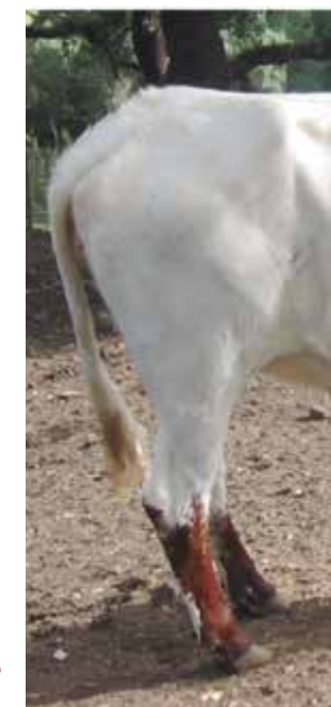
Grupa descendida, apta pero no deseable