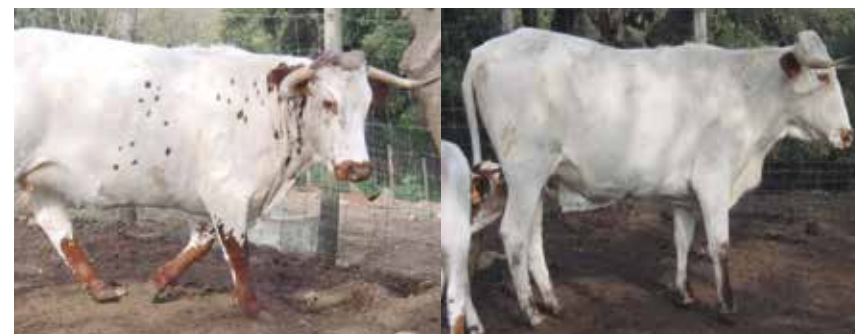
Animales NO aptos con capa excesivamente blanca con pérdida del capirote

En este caso se reconoce y acepta la capa salinera que hasta este momento presentaba discrepancias y estaba siendo parcialmente descalificada.