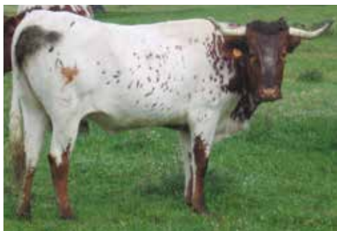
Botinero apto pero menos recomendable al abrirse el colorado por detrás

tinte retinto, especialmente en los toros. La dilución del color periócular (ojo de perdiz) suele ser constante, así como alrededor del morro (bociclano). La zona blanca comprende la banda raquidiana que con frecuencia incluye la cruz y siempre la grupa y cola en el plano superior del tronco; y la región perineal, genitales, ubre (salvo pezones a veces)