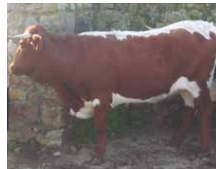
Hembra NO apta por tener dos uniones