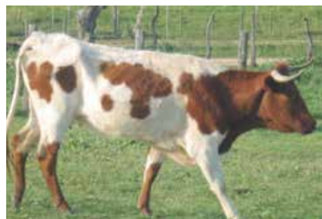
Animal NO apto al tener una extremidad blanca

y bajo vientre hasta el esternón en los planos laterales e inferior. Las cuatro particularidades pigmentarias quedarían definidas como: raza rubia, capirote, alumbrada y botinera.