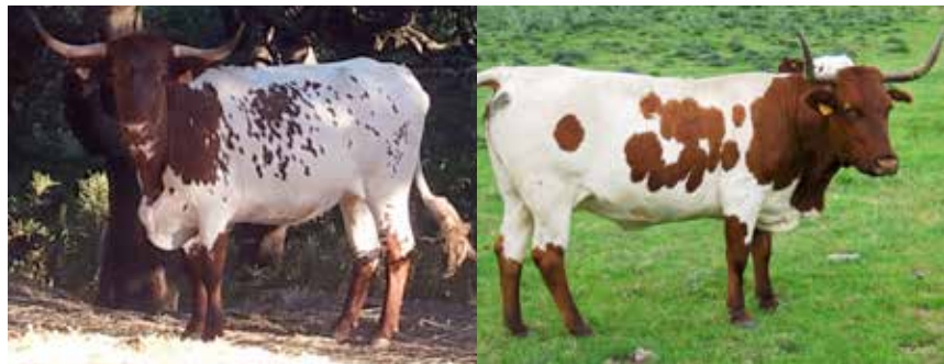
Animales aptos con capa capirote y botinera formas alunaradas difusas y agrupadas

menor densidad y más o menos agrupadas, fusionadas, separadas o dispersas, pero siempre la intensidad del manchado es decreciente de delante a atrás. Las zonas pigmentadas pueden no ser uniformes y dar lugar a las expresiones cromáticas que los ganaderos denominan: flor de gamón, salpicado, etc., como igualmente sufrir la invasión de pelos blancos (salinera).