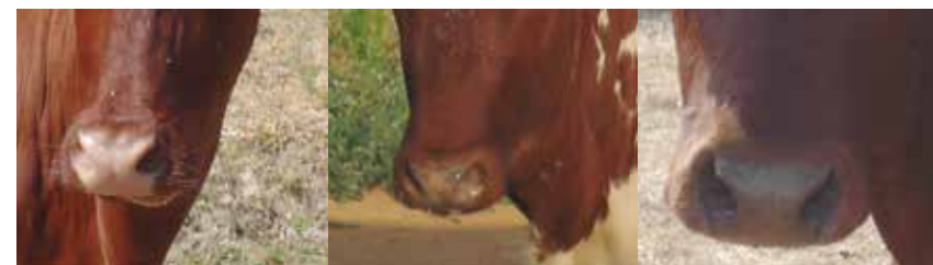
Mucosa apta y deseable

Será descalificable la presencia de mucosa negra.