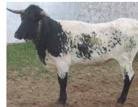
Línea dorso-lumbar apta pero no deseable por manifestar depresión

Se puntuarán, tanto en machos como hembras, más la línea dorsolumbar recta que la que muestre una ligera depresión, siendo deseable las depresiones extremadamente manifiestas y el conocido como lomo de gato.