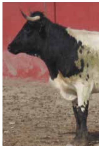
Papada apta pero no recomendable por ser escasa

Corto, fuerte y musculado en los machos. Bien desarrollado en las hembras con papada amplia y discontinua que se extiende desde el esternón y pende hasta la mitad de las extremidades anteriores.