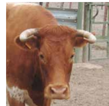
Animal No apto por la excesiva concavidad, denota cruce

Los cuernos gruesos y desarrollados obtendrán una puntuación mayor que los no desarrollados, siendo descalificable en los machos los cuernos gachos que, por otra parte, recuerdan a posibles cruces con razas cárnicas.