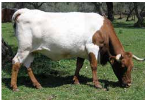
Animal apto con capa capirote y botinera

La capa es Berrenda en Colorado capirote, botinera de las cuatro, ojo perdiz y bociclara, pudiendo llegar a aparejado o remendado. Es decir, las manchas rojas ocupan la cabeza y cuello (capirote), luego se extienden al tronco, donde se localizan bajo las formas alunaradas grandes o placas redondeadas, con mayor