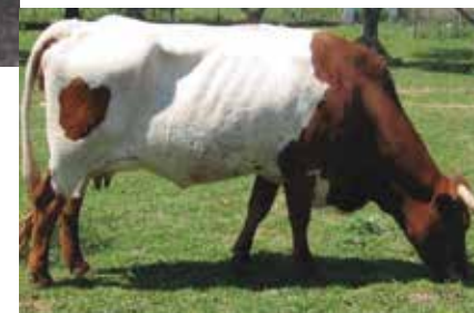
Hembra apta aunque no recomendable por tener una unión

Serán desechables las tonalidades anaranjadas que denoten cruce de razas, así como aquella distribución de manchas que recuerden a capas características de, especialmente, la raza Mertolenga. También las atigradas.