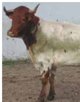
Papada escasa, apta pero no deseable

Puntuará positivamente la presencia de badana que denote la rusticidad de la raza, siendo rechazable la no presencia de esta.