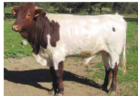
Botinero apto y recomendable

En este caso se reconoce y acepta la capa salinera que hasta este momento presentaba discrepancias y estaba siendo parcialmente descalificada.