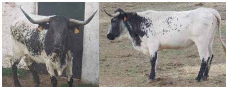
Animales aptos pero no deseables por inclusión de pelos blancos

banda a partir de la cruz o un poco antes más o menos regular, para ensancharse a nivel de los riñones, extenderse por la parte superior de la grupa (palomilla y cadera) y afecta a la totalidad de la cola. En los costados ocupa sólo las partes altas dejando una banda blanca de separación con el manchado de los miembros. En la región inferior otra franja va del esternón al periné, también ganando anchura de delante a atrás.