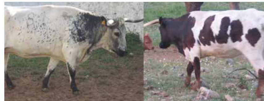
Animales NO aptos por caras excesivamente blancas