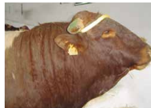
Animal apto aunque no deseable por la excesiva convexidad de la cara (acarerada)

Orejas pequeñas, arcadas orbitarias algo salientes, ojos grandes y vivos.