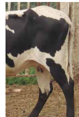
Grupa apta pero no deseable por ser muy descendida

Obtendrán mayor puntuación las grupas largas y rectas que las rectas y cortas, siendo no deseable las grupas descendidas.