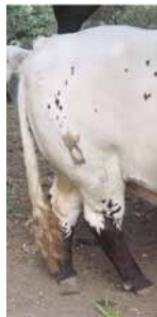
Nalga apta, pero no deseable por excesiva convexidad