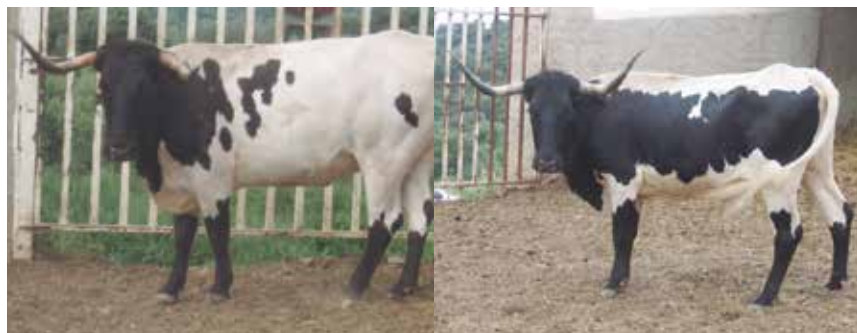
Animal apto con capa capirote

La capa es Berrenda en Negra aparejada, con las particularidades de capirote, botinera y alunarada. El negro afecta a la cabeza y cuello (capirote) partes laterales del tronco con simetría perfecta (aparejado) y las cuatro extremidades (botinero). El color blanco puro forma una