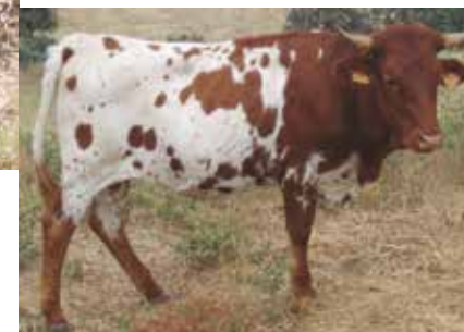
Animal NO apto distribución que denota cruce con otra raza