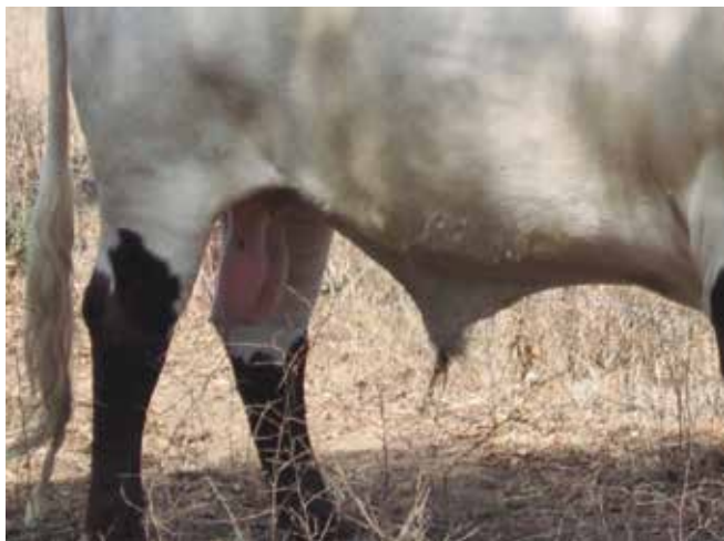
Prepucio apto pero no deseable por ser descolgado

Se puntuarán más los prepucios recogidos y grandes, luego los recogidos y posteriormente los descolgados.